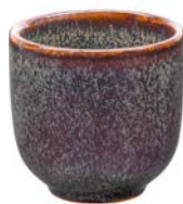
Koffiekop, 15cl 600121.002