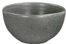
Thee/Latte kop, 22,5cl 600130.010