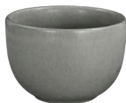
Koffie/cappuccino kop, 18cl 600130.009