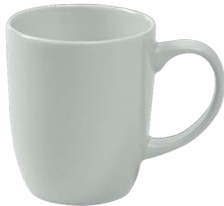
Nordika Beker Bern, 25cl 500001.027