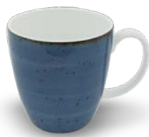
Saturno Nature Dark Blue, 33cl 500019.414