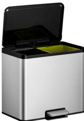
Essential Recycler, 15+15ltr 56.1691