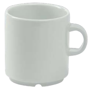
Ocean Automatenmok, 23cl 500001.214