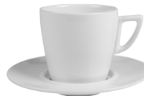
Koffiekop Retro Hoog, 18cl 600001.306