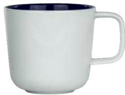
Nordika Fjord White/Blue, 30cl 500134.315