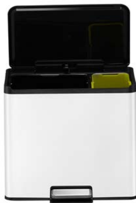
Essential Recycler, 20+9ltr 56.1692