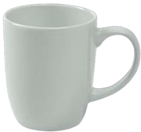
Nordika Beker Zurich, 20cl 500001.025