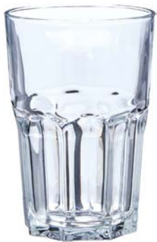
Glas Granity, 35cl 14.1320