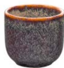
Espressokop, 10cl 600121.001