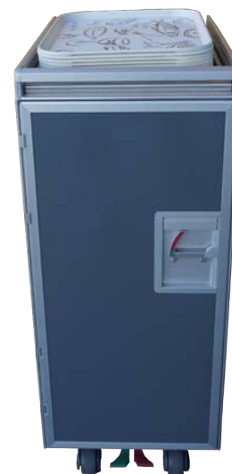
Flight Trolley, Dienbladen 76.3052 & 76.3062 of 76.3064