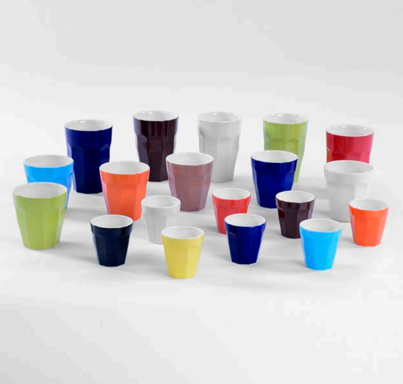
Cafélegante, verkrijgbaar in 3 maten & verschillende kleuren