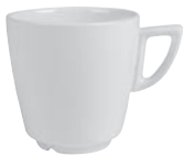
Koffiebeker Retro, 25cl 600001.328