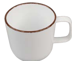
Nordika Coral Brown, 30cl 500008.315