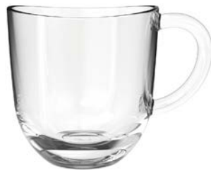
Koffieglas Napoli, 28cl 14.7487