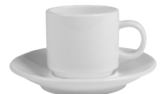
Koffiekop Inspiration, 16cl 600001.313