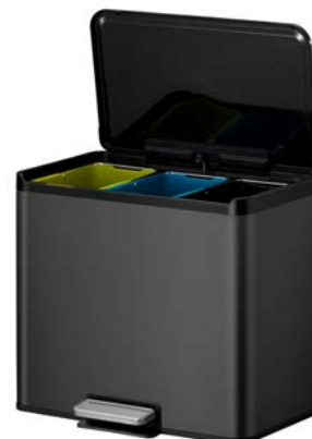
Essential Recycler, 9+9+9ltr 56.1695