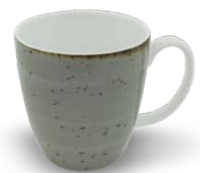
Saturno Nature Taupe, 33cl 500017.414