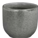
Espressokop, 9cl 600130.008