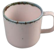
Moods Flirty, 30cl 500015.315