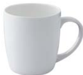
Koffiebeker Diva, 30cl 600001.514