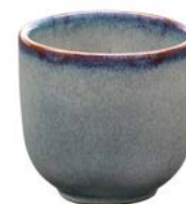
Koffiekop, 15cl 600122.002