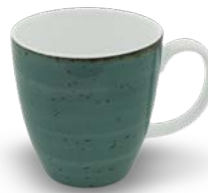
Saturno Nature Green, 33cl 500018.414