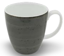
Saturno Nature Grey, 33cl 500020.414