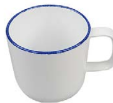
Nordika Coral Blue, 30cl 500007.315