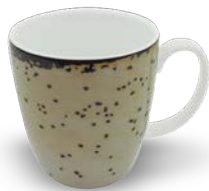
Saturno Nature White, 33cl 500021.414