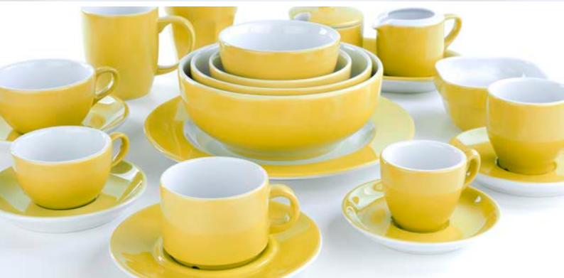
Mix & Match, verkrijgbaar in verschillende maten & kleuren