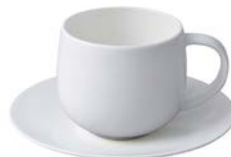
Koffiekop Cocoon, 16cl 600001.604