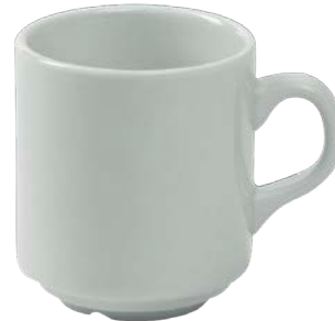
Nordika Automatenmok, 23cl 500001.014