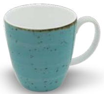
Saturno Nature Blue, 33cl 500023.414