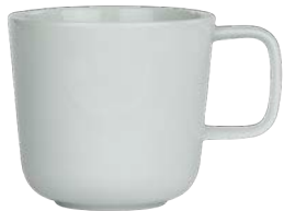
Nordika Fjord White, 30cl 500001.315