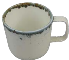
Moods Dreamy, 30cl 500011.315