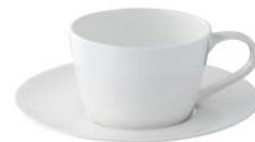
Koffiekop Diva, 16cl 600001.504