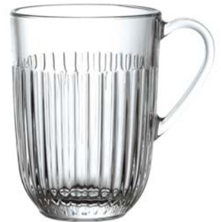
Theeglas La Rochere, 40cl 14.5854