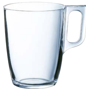
Koffie-/theeglas Voluta, 32cl 14.5309