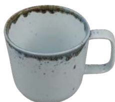
Moods Joyful, 30cl 500012.315