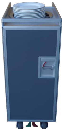
Flight Trolley, Borden 76.3052 & 76.3060