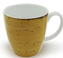
Saturno Nature Yellow, 33cl 500022.414