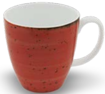
Saturno Nature Red, 33cl 500024.414