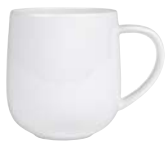
Koffiebeker Cocoon, 30cl 600001.614